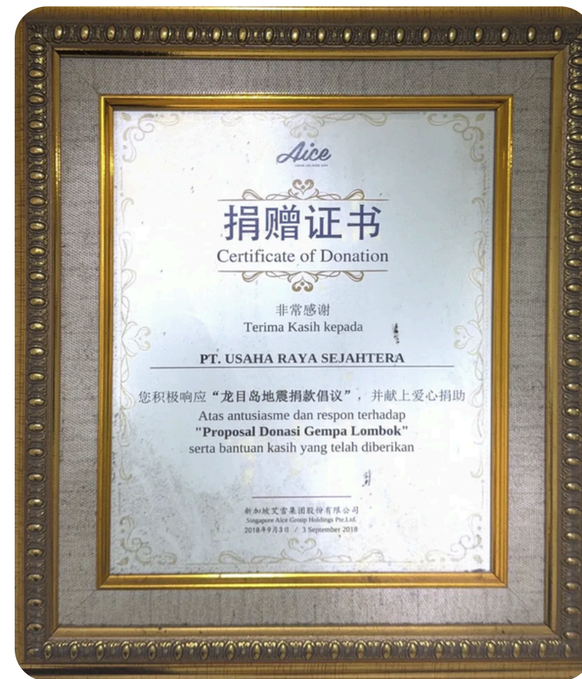
Sertifikat Penghargaan diterbitkan oleh AICE Group · 2018. Kontribusi dalam bantuan gempa Lombok.