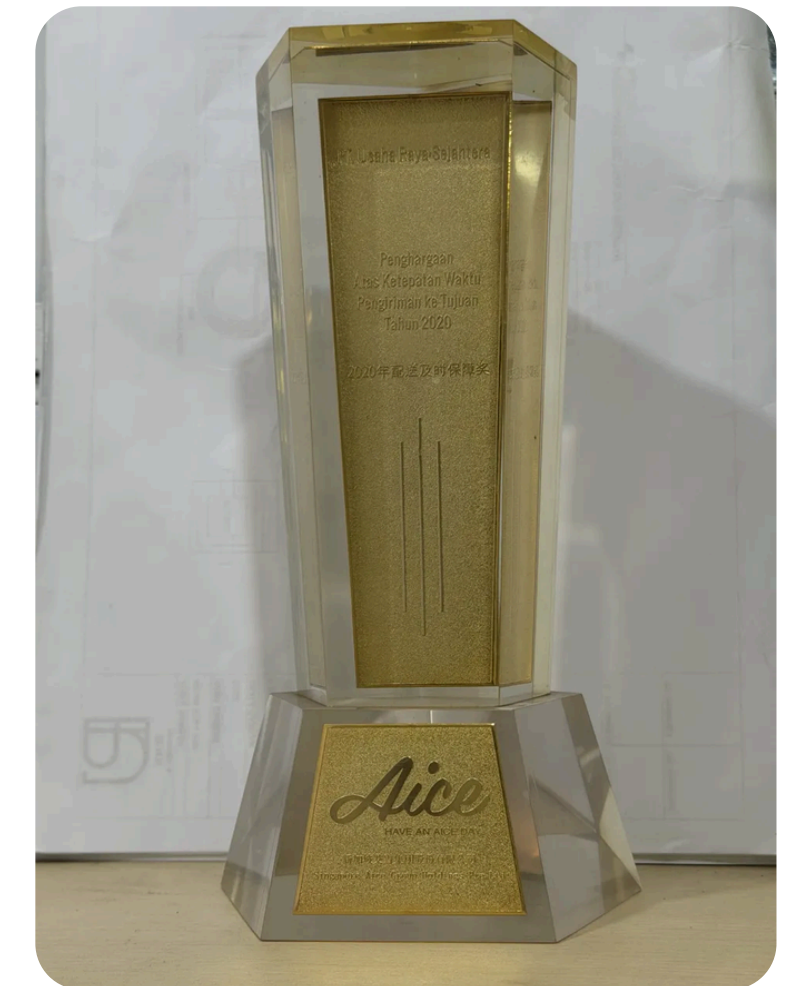
Penghargaan Ketepatan Waktu Pengiriman diberikan oleh AICE Group · 2020. Kinerja pengiriman konsisten secara nasional.