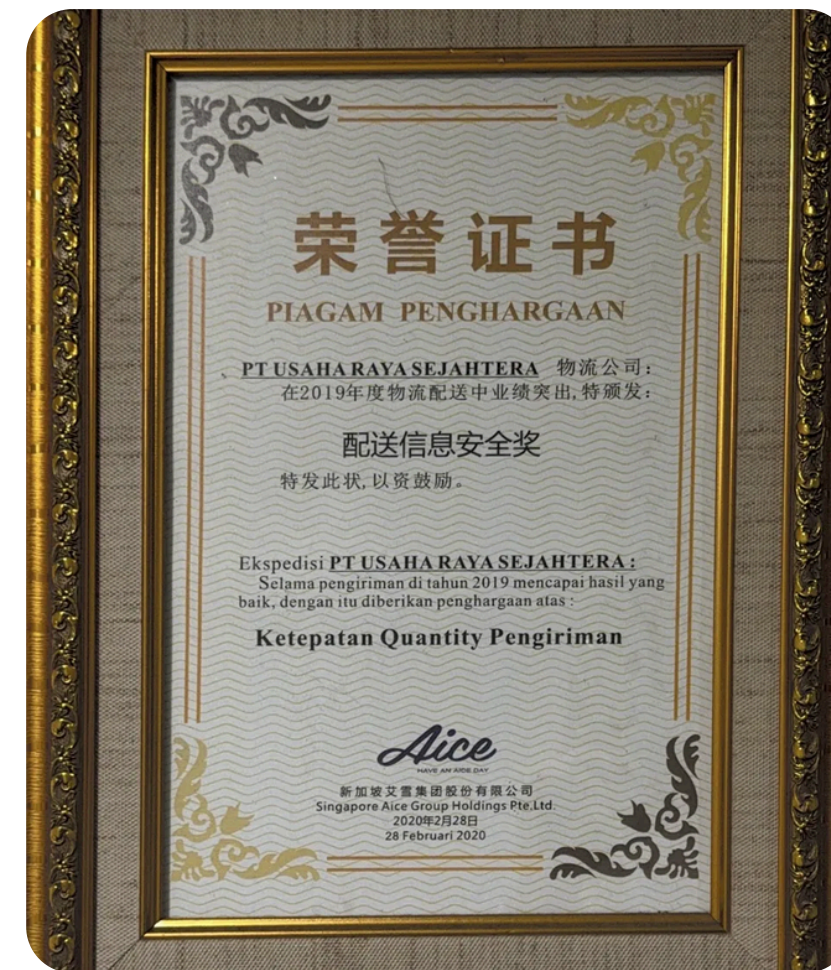
Penghargaan Akurasi Pengiriman diberikan oleh AICE Group · 2019. Kinerja unggul dalam ketepatan jumlah pengiriman.